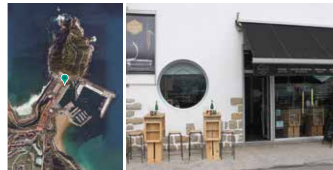
Dans le port de Getaria